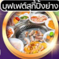
บุฟเฟ่ต์สุกี้ปิ้งย่าง