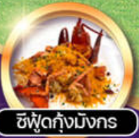
ซีฟู้ดกุ้งมังกร