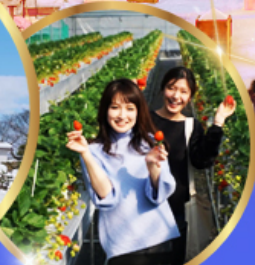
บุฟเฟ่ต์ สตอเบอร์รี่ เก็บสดจากต้น