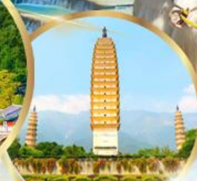
เจดีย์สามองค์