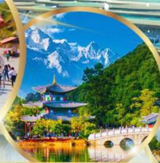
สระมิ่งกรดำ