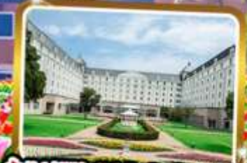
พัก Hotel Nikko Huis Ten Bosch ★★★★★