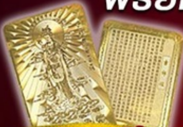
แถมฟรี แผ่นทองเจ้าแม่กวนอิม