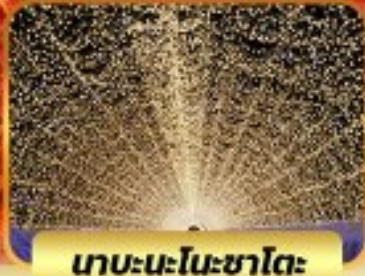
บาระนะโนะซาโตะ