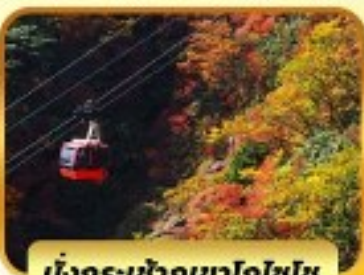
นั่งกระเช้าภูเขาโทโชไซ