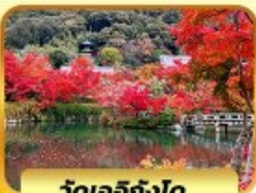
วัดเออิกังโด