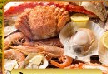
บิงย่างร้านดังเน้นตะ