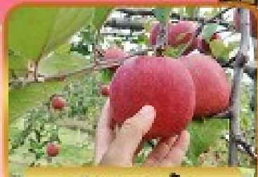
เก็บแอมเปิ้ล