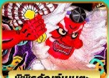
ไฟฟิรท์ลท์ที่เนบูตะ