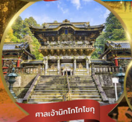
ศาลเจ้ามิกโกโทโซกุ