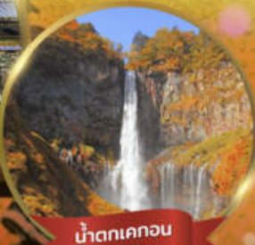
น้ำตกเคกอน