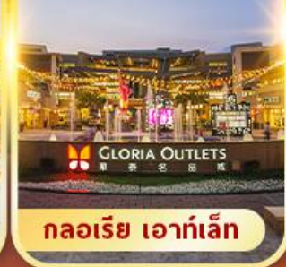
กลอเรีย เอาท์เล็ต