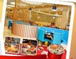
ก๊วยแม่น้ำ + HOTPOT SEAFOOD