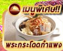
เมนูพิเศษ!! พระกระโดดกำแพง