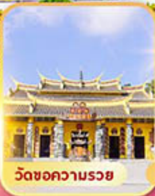
วัดขอความรอย