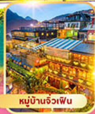
หมู่บ้านจิวเฟิน

พักซิเหมินตง 2 คืน เที่ยวเต็มไม่มี Free Day