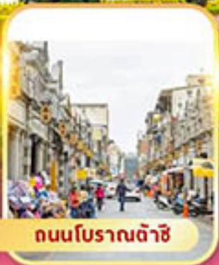
ถนนโบราณต้าซี