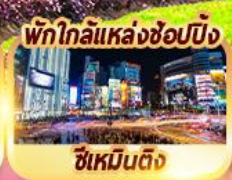
พักใกล้แหล่งช้อปปิ้ง ซีเหมินติง