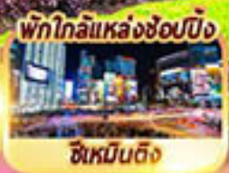
พักใกล้แหล่งช้อปปิ้ง ซิเหมินตง