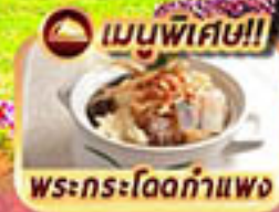
เมนูพิเศษ!! พระกระโดดกำแพง