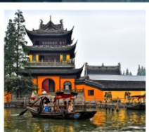
หมู่บ้านโบราณจูเจียเจียว

สวนสนุกยูนิเวอร์แซลปักกิ่ง / สวนสนุกเซี่ยงไฮ้ดิสนีย์แลนด์ / หมู่บ้านโบราณจูเจียเจียว ขึ้นหอไข่มุก / ลอดอุโมงค์เลเซอร์ / หาดไต้หวัน / จัดธุรกิจอันheimin พระราชวังโบราณปักกิ่ง / กำแพงเมืองจีนด่านจี้หยงกวน สนามกีฬาโอลิมปิกปักกิ่ง / ถนนโบราณเจียนheimin