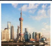
หอไข่มุก