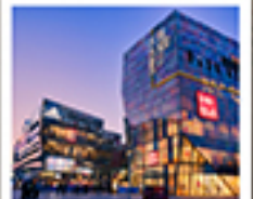
ย่านซานหลี่ตุ๋น