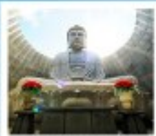
เนินพระพุทธรเจ้า