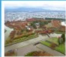
ไร่ริยวกะกุ ทาวเวอร์

หมู่บ้านรถจักรยาน / ไร่ดังฮังของคานามิชิ ตลาดเช้าเมืองฮาโกดาเตะ / ไร่ริยวกะกุ ทาวเวอร์ ภูเขาไฟอุสุ / จุดชมวิวยุซึกิ / ค่องเรือชมทะเลสาบโทบะ สวนอุสึกิโตะ / สวนพฤกษศาสตร์ / เก็บผลไม้ / สัมผัสน้ำพุร้อน พิพิธภัณฑ์คองดงดริ / ภาวนาโอบาโนราชน / ไร่ป่าแก้วคิตาฮิชิ เนินพระพุทธรเจ้า / ถนนฮิโอบังทาบูกิโกจิ / ย่านฮูซุกิโนะ