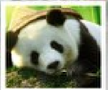
ดูมัทมิชเมต้า

อุทยานหวงหลง / อุทยานจิ่วจ้ายโกว / โรว์ฟิวดดูมัทมิชเมต้าแพด้าดูเจียงเซี่ย / สวนดอกไม้ทิ่กูว / ระเบิดงเท่ว / ถนนถนนเดินสูบซีง / ถนนโบราณจีนหนี่