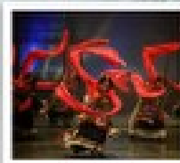
โรว์ฟิวด