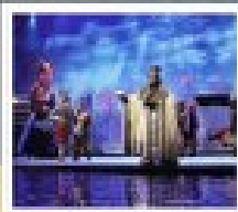
โหล่วซานกิก

มหาศาลาประชาชน / จตุรัสเทียนเหมิน หลงชาง / ถนนท่าด่านเจี๋ย / ส่องเรือสำราญ แม่น้ำแยงซีเกียง โหล่วซานกิก / ช่องแคบฮวงกิงเหียบ / ช่องแคบตงตง / นั่งเรือลี้กวมตั้นเหนี ชมเขื่อนสามเสียดำป้า / นั่งลิฟท์ข้ามเขื่อนสามเสียดำป้า / พิพิธภัณฑ์เขื่อนสามเสียดำป้า