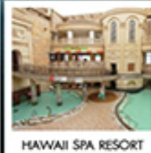
HAWAII SPA RESORT