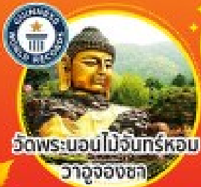
วัดพระบอนไม้จันทร์หอม วาจุงองชกา