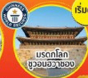
มรดกโลก ชวอนฮวาซอง