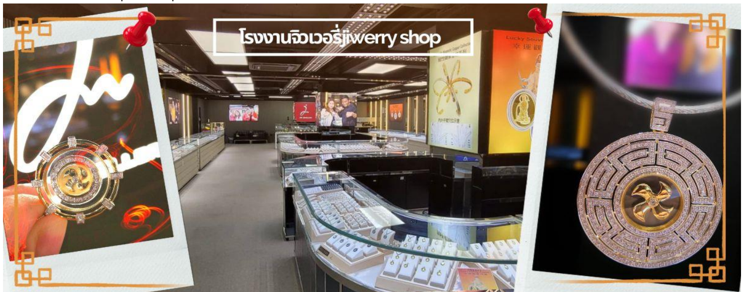
โรงงานจิวเวอรี่ jewelry shop

จากนั้นนำท่านชม โรงงานจิวเวอรี่ ซึ่งเป็นโรงงานที่มีชื่อเสียงที่สุดของฮ้างกงในเรื่องการออกแบบเครื่องประดับ อาทิเช่น จี้ และแหวนกำหั้น ที่สวยงามโดดเด่นไม่เหมือนใคร ซึ่งถือกำเนิดขึ้นที่นี่และมีชื่อเสียงที่สุดใช้เป็นเครื่องประดับติดตัว และเสริมดวงชะตา สินค้าทุกชิ้นมีเอกสารรับประกันคุณภาพเปลี่ยน ซ่อม ใต้ตลอดอายุการใช้งาน หากเกิดการชำรุดจากสินค้าไม่ใช่อุบัติเหตุ และนำท่านเลือกซื้อ เครื่องประดับที่ ร้านหยก ซึ่งคนจีนนั้นถือว่าหยกเป็นหิน ที่เป็นตัวแทนของความสวยงามและความบริสุทธิ์ มีความเชื่อว่าหยกมงคล ถ้าพกติดตัวไว้จะอายุยืนและสุขภาพดี