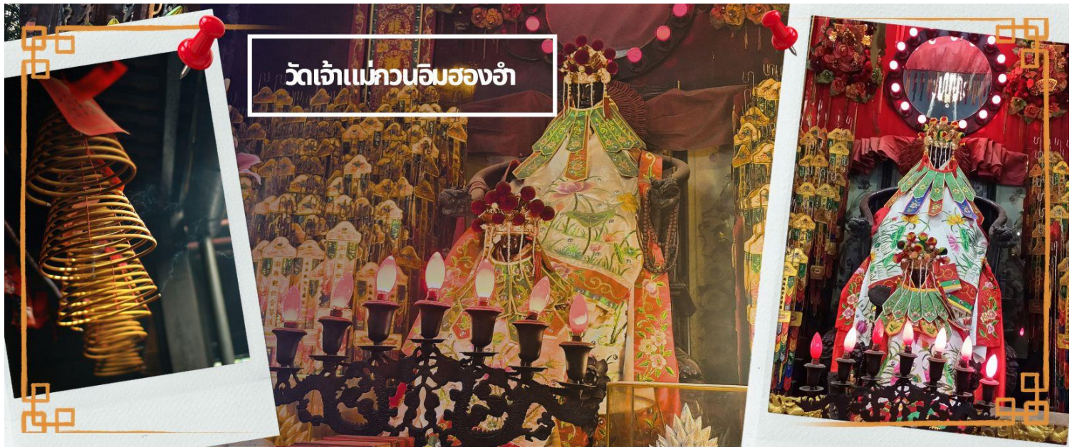
วัดเจ้าแม่ทวนอิมฮ้างกง

จากนั้นนำท่านชม โรงงานจิวเวอรี่ ซึ่งเป็นโรงงานที่มีชื่อเสียงที่สุดของฮ้างกงในเรื่องการออกแบบเครื่องประดับ อาทิเช่น จี้ และแหวนกำหั้น ที่สวยงามโดดเด่นไม่เหมือนใคร ซึ่งถือกำเนิดขึ้นที่นี่และมีชื่อเสียงที่สุดใช้เป็นเครื่องประดับติดตัว และเสริมดวงชะตา สินค้าทุกชิ้นมีเอกสารรับประกันคุณภาพเปลี่ยน ซ่อม ใต้ตลอดอายุการใช้งาน หากเกิดการชำรุดจากสินค้าไม่ใช่อุบัติเหตุ และนำท่านเลือกซื้อ เครื่องประดับที่ ร้านหยก ซึ่งคนจีนนั้นถือว่าหยกเป็นหิน ที่เป็นตัวแทนของความสวยงามและความบริสุทธิ์ มีความเชื่อว่าหยกมงคล ถ้าพกติดตัวไว้จะอายุยืนและสุขภาพดี