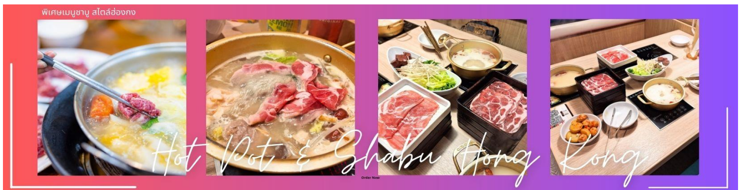
พิเศษเมนูชาบู สไตล์ฮ้างกง

กลางวัน ๑๐ | บริการอาหารกลางวัน ณ ภัตตาคาร .....พิเศษเมนูชาบู สไตล์ฮ้างกง (2)