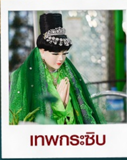
เทพกระซิบ