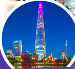
ดีกิล็อคเด็มจอกส์