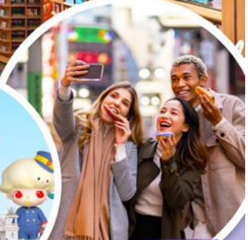
ตลาดเมืองดง

ตารางบิน สายการบินอีสตาร์ เจ็ท (ZE) ขึ้น ชั้นเครื่องสุวรรณภูมิ