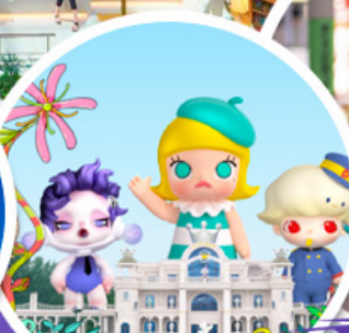
ช้อปบิง POP MART