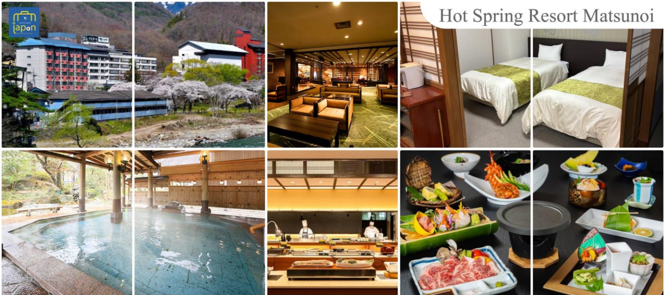
Hot Spring Resort Matsunoi

รับประทานอาหารค่ำ ณ ภัตตาคาร ของโรงแรม (5) --- บุฟเฟต์นานาชาติ หลังอาหารให้ท่านได้ผ่อนคลายกับการแช่น้ำแร่ธรรมชาติ เชื่อว่าถ้าได้แช่น้ำแร่แล้ว จะทำให้ ผิวพรรณสวยงามและช่วยให้ระบบหมุนเวียนโลหิตดีขึ้น