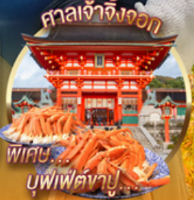
ศาลเจ้าจิ้งจอก ฟิเศษ บุฟเฟ่ต์จายู