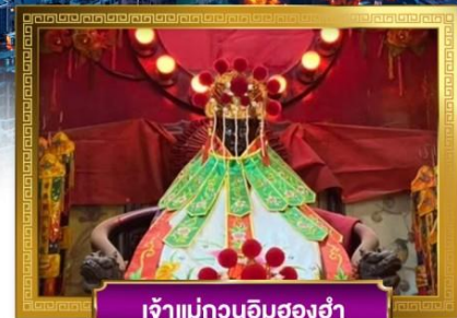
เจ้าแม่กวนอิมสองฮ่า