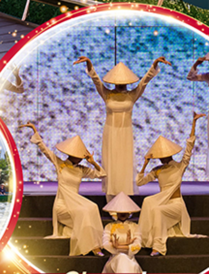
Charming Danang Show