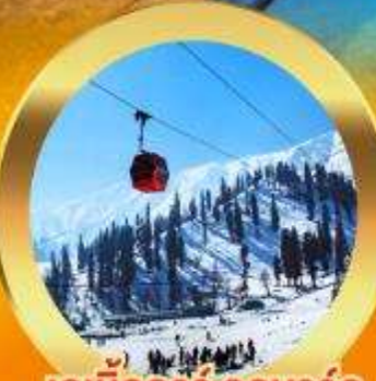
เคเบิลคาร์ กุลมาร์ค