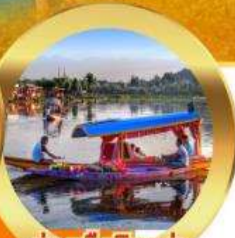
ล่องเรือชิคาร่า