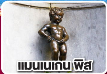
แมนเนเกน ฟิส

ฝรั่งเศส เบลเยียม ลักเซมเบิร์ก เยอรมนี เนเธอร์แลนด์ 8 วัน 5 คืน