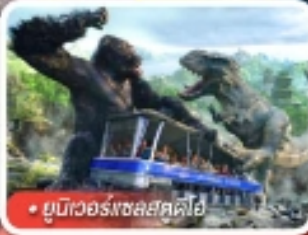
ยูนิเวอร์สอลสตูดิโอ