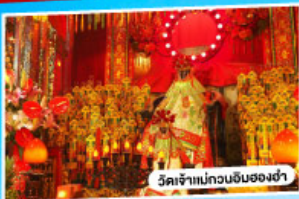
วัดเจ้าแม่กวนอิมของเซ้า

*นั่งรถข้ามสะพานเซินเจิ้น-จงซาน "สะพานข้ามทะเลที่สูงที่สุดในโลก"