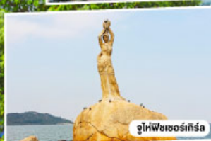
จูไห่พีซเซอร์เกิร์ล