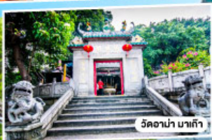
วัดอาปา มาเก๊า