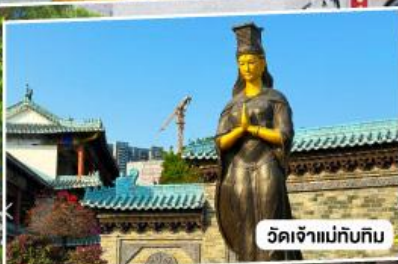
วัดเจ้าแม่กั๊กทิม