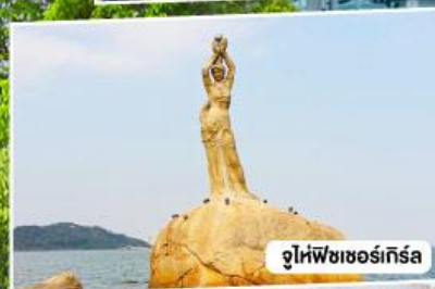
จูไห่พีชเชอร์เกิร์ล