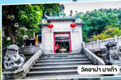
วัดอามาเก๊า