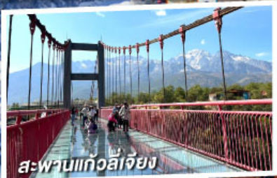
สะพานแกวล์ลี้เจียง