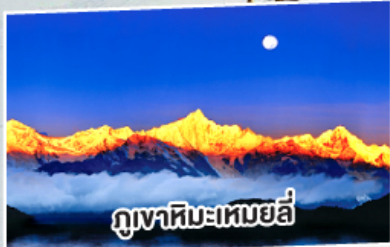
ภูเขาหิมะเหมยลี่