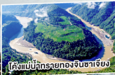
โค้งแม่น้ำทรายทองจินซาเจียง