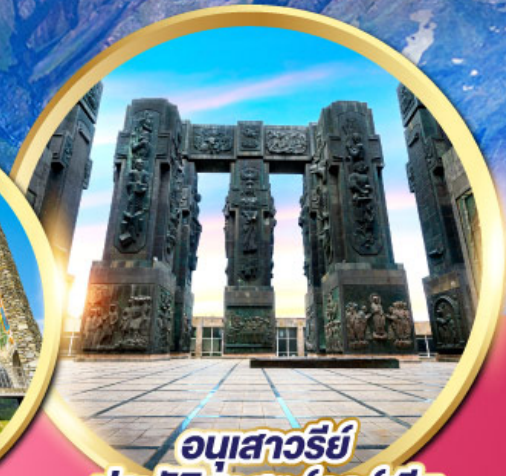
อนุสาวรีย์ ประวัติศาสตร์จอร์เจีย