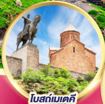
โบสถ์เมเดค