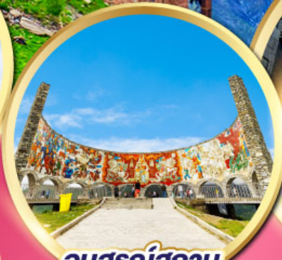
อนุสรณ์สถาน รัสเซีย-จอร์เจีย