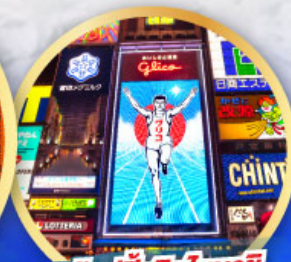
ช้อปปิ้งชินโซบาชิ

เดินทาง 14-19, 21-26 ม.ค. 68 06-11, 13-18 ก.พ. 68 13-18 มี.ค. 68