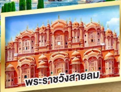
พระราชวังสีชมพู