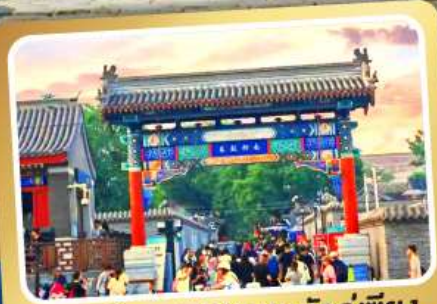
ถนนโบราณหนานหลิวกู่เซียง