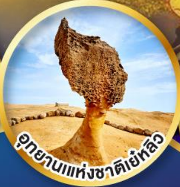
อุทยานแห่งชาติเย่หลิ่ง