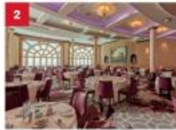
Dream Dining Room Savour Chinese and Western cuisine in our elegant main inclusive dining room.