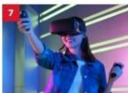
ESC Experience Lab Experience the latest in virtual and augmented reality technology for non-stop thrills.