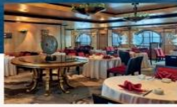
Silk Road Traditional Dim Sum and Cantonese cuisine