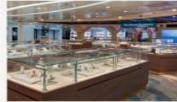
The Boutiques International duty-free shopping