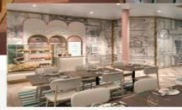
The Little Cake Café Decadent cakes and artisanal chocolates