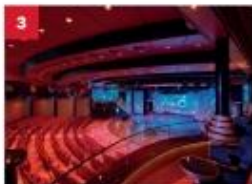
Zodiac Theatre Catch a signature production live show in our opulent theatre.