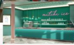
Matcha Ice Popular Matcha ice cream and Taiwan milk tea