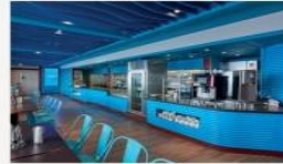
Blue Lagoon Delicious hawker food with Asian and International classics