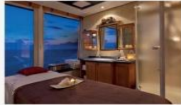
Spa Private treatment rooms, reflexology lounge and saunas