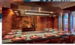
Umi Uma Sushi & Teppanyaki Signature Japanese dishes