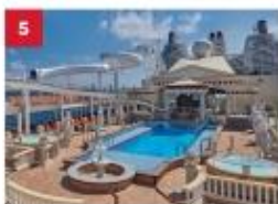
Parthenon Pool Go for a dip in our outdoor Roman-themed pool deck with Caesar's Slide, hot tubs, a stage for live bands and a mega LED screen.