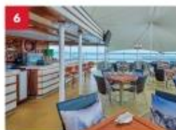
Seafood Grill Enjoy your favourite outdoor hot pot dining with a wide selection of meats, seafood or vegetarian options, paired with an extensive beverage list.