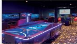
The Zone Multipurpose lounge featuring game consoles