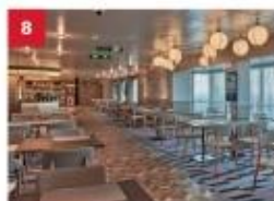
Mozzarella Ristorante & Pizzeria For adventurous foodies, savour a modern fusion of classic Italian dishes and pizzas with a Japanese twist.