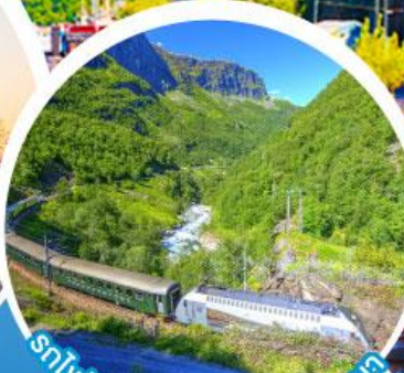
รถไฟสายโรเมนติกฟลัมสบานา