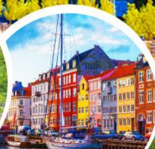
ท่าเรือฮาวน์.โตเปนฮากน