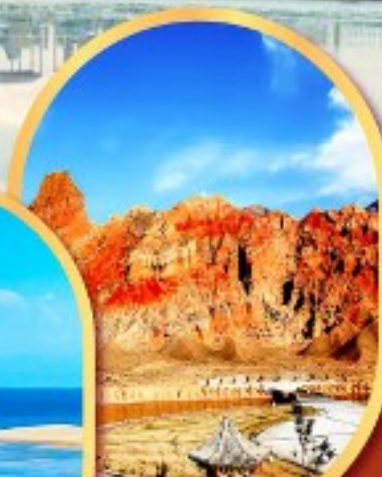
หุบเขาห้าสี อุทยานธรณีกุยเต๋อ