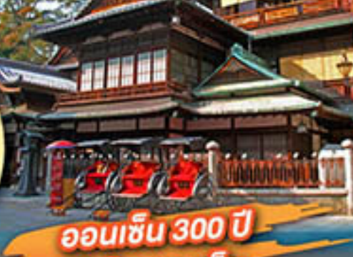
ออนเซ็น 300 ปี โดโจ-ออนเซ็น