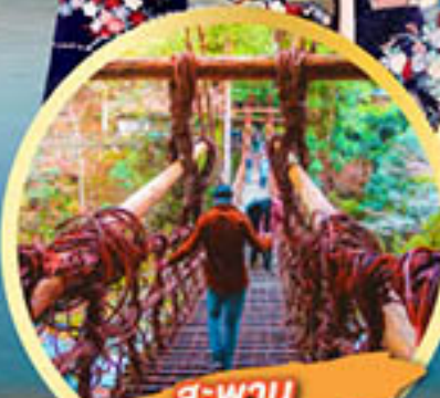
สะพาน อียะโนคะชิระบะชิ