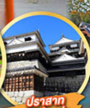
ปราสาท มัตสึยาม่า