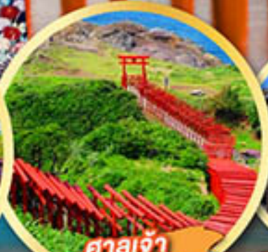
ศาลเจ้า ไมโดโนะซุมิ อินาริ