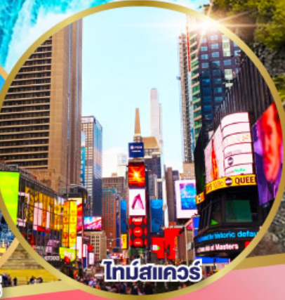
ไทม์สแควร์