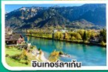
อินทอร์สทาก์