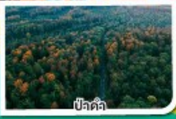
ปีซัตต้า

เดินทาง 20-26 ต.ค. 67 07-13 พ.ย. 67 05-11 ธ.ค. 67