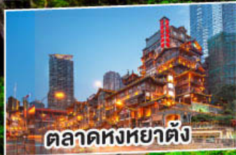
ตลาดหงหยาดัง