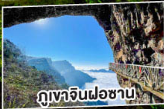
ภูเขาจินฝอซาน