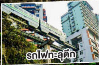
รถไฟเหาะตุ๊ก