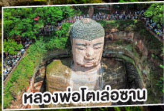
หลองฟอโตเล่อซาน