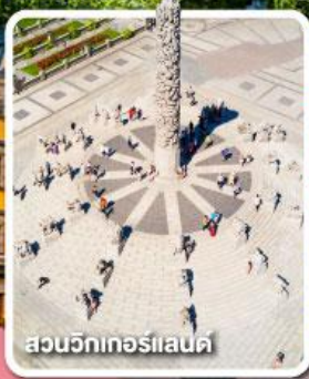
สวนวิกทอร์แลนด์