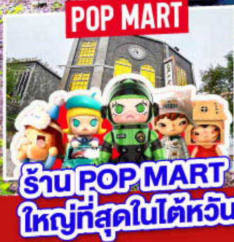
ร้าน POP MART ใหญ่ที่สุดในไต้หวัน