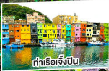
ท่าเรือจิ้งปิ่น