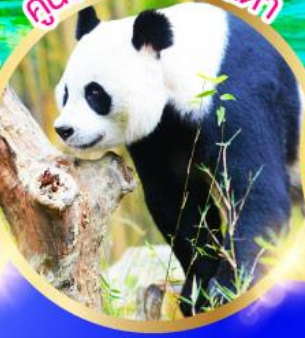
ศูนย์วิจัยหมีแพนด้า