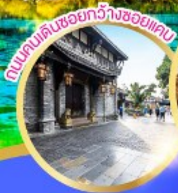
ถนนคนเดินชอยกวางชอยแคม