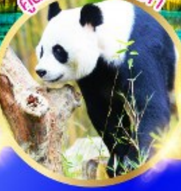
คู่มือวิจัยหมีแพนด้า