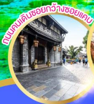
ถนนคนเดินชอยกวางชอยแคบ