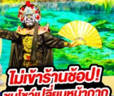
ไม่เข้าร้านช้อปปิ้ง! ชมโชว์เปลี่ยนหน้ากาก