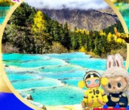
อุทยานแห่งชาติหลงหลง