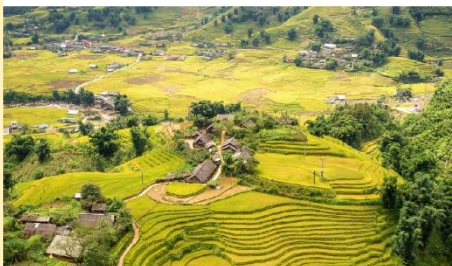
หมู่บ้านต้าฟาน