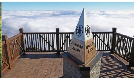
ยอดเขาฟานซิปิน