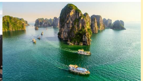
ล่องเรือชมอ่าวฮาลอง

*ทางบริษัทฯ ขอสงวนสิทธิ์ในการสลับโปรแกรมทัวร์ตามความเหมาะสมขึ้นอยู่กับสถานการณ์หน้างาน โดยคำนึงถึงผลประโยชน์ของลูกค้าเป็นสำคัญ