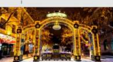
ถนนคนเดินจงหยาง