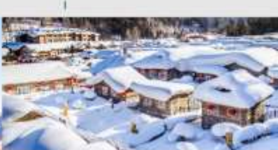
หมู่บ้านหิมะ

*ทางบริษัทฯ ขอสงวนสิทธิ์ในการสลับโปรแกรมทัวร์ตามความเหมาะสมขึ้นอยู่กับสถานการณ์หน้างาน โดยคำนึงถึงผลประโยชน์ของลูกค้าเป็นสำคัญ