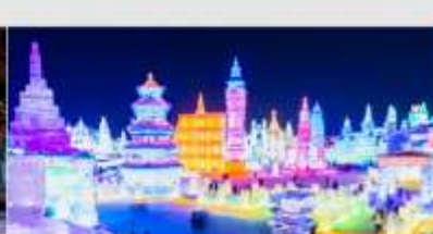
เทศกาลโคมไฟน้ำแข็ง