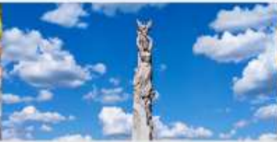
สวนประติมากรรมโลกฉางชุน