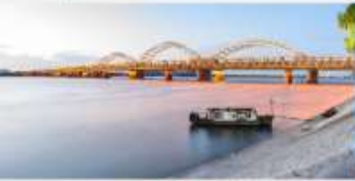
สะพานชงฮวาเจียง